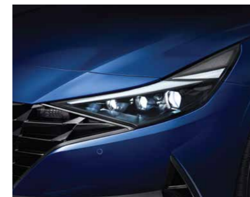
Đèn chiếu sáng LED (Phiên bản 1.6 AT/2.0 AT/N Line)

Thiết kế khác biệt với phần lưới tản nhiệt “Parametric Dynamics” tạo thiết kế mạnh mẽ, góc cạnh, thể thao cho Elantra