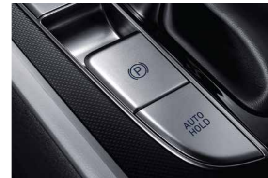
Phanh tay điện tử