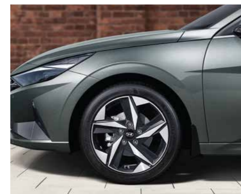
Vành hợp kim 17 inch 2 tone màu (Phiên bản 2.0 AT)