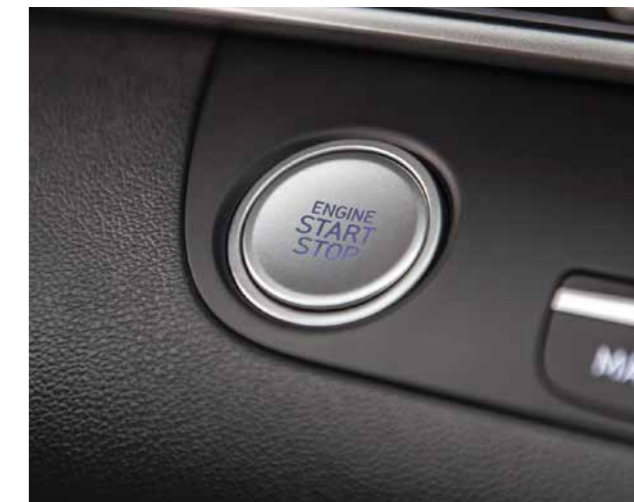
Khởi động bằng nút bấm