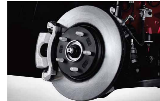
Đĩa phanh kích thước lớn