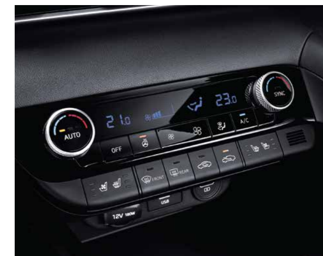
Điều hòa tự động