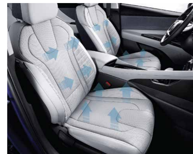
Sưởi và làm mát ghế