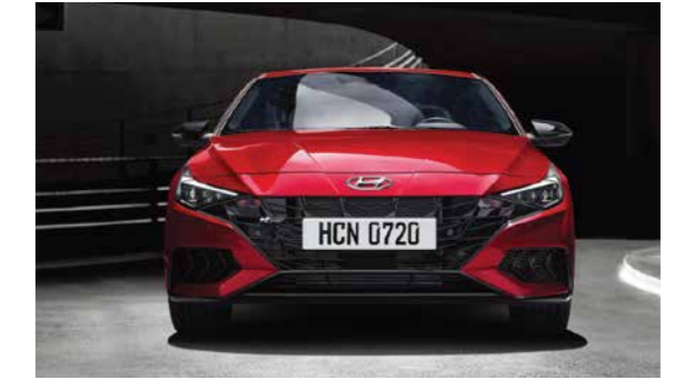
Cản trước với hốc hút gió lớn