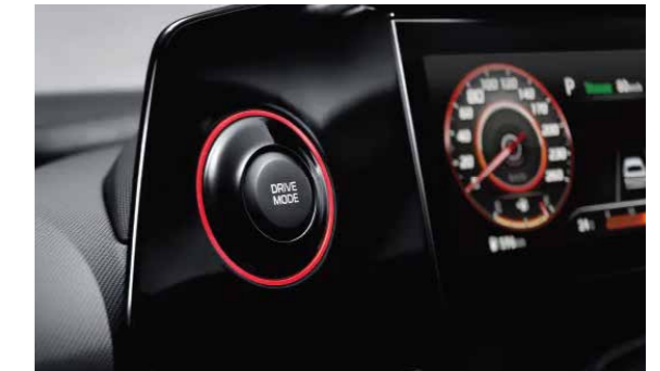
Nút bấm chuyển chế độ lái