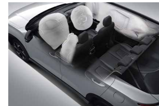
6 túi khí