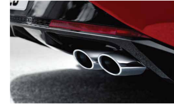
Bô đôi thể thao