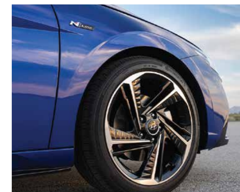
Vành hợp kim 18 inch 2 tone màu (Phiên bản N Line)