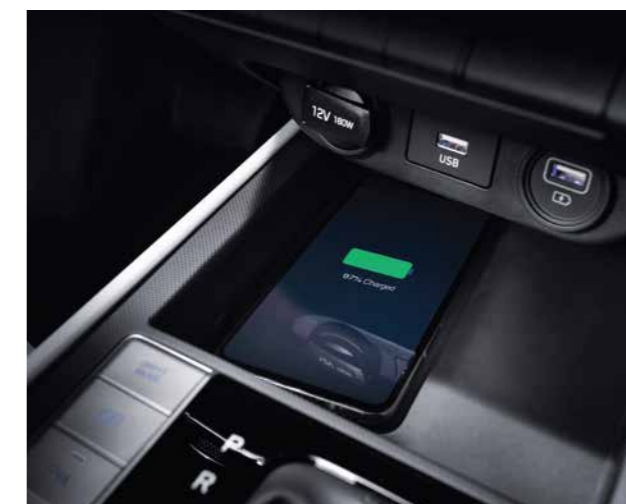
Sạc không dây