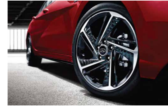
Vành hợp kim 18 inch