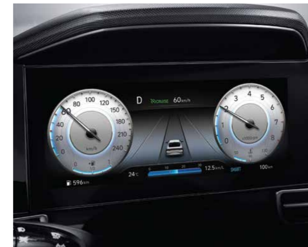
Màn hình thông tin digital 10.25 inch