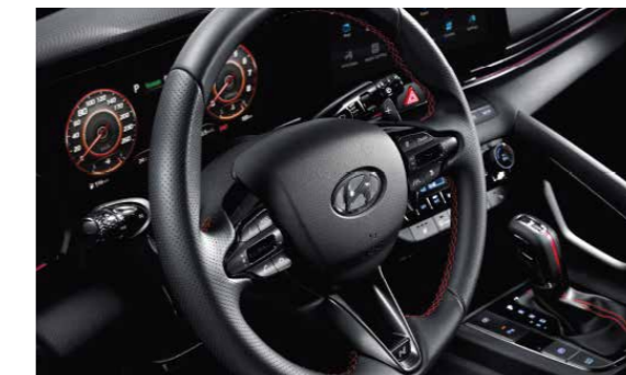
Vô lăng 3 chấu khâu chỉ đỏ