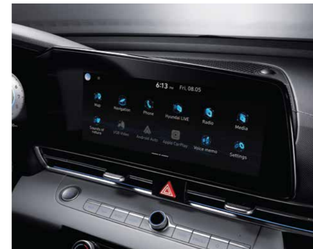
Màn hình giải trí 10.25 inch

Với các đường nét đơn giản nhưng đầy tính thể thao gợi cảm, All New Elantra mang đến một không gian nội thất hài hòa cùng không khí thể thao tràn ngập trong khoang lái