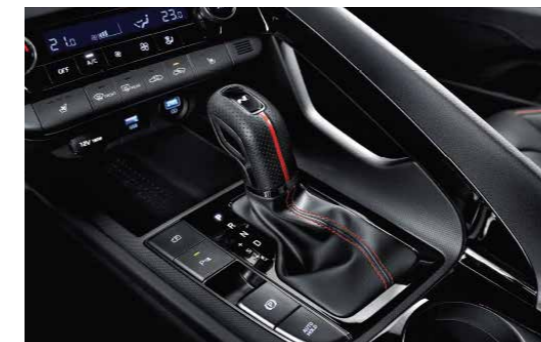
Cần số thể thao N Line