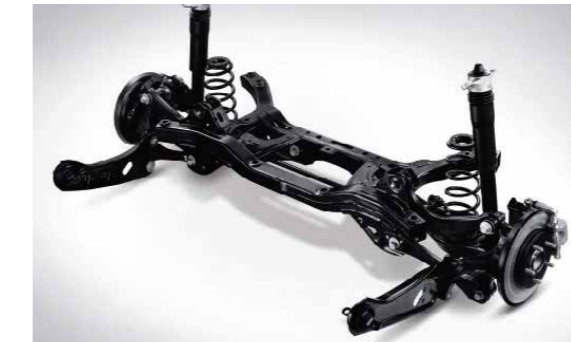
Hệ thống treo sau đa liên kết