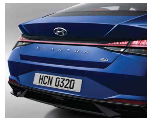
Cụm đèn hậu dạng LED (Phiên bản 1.6 AT/2.0 AT/N Line)