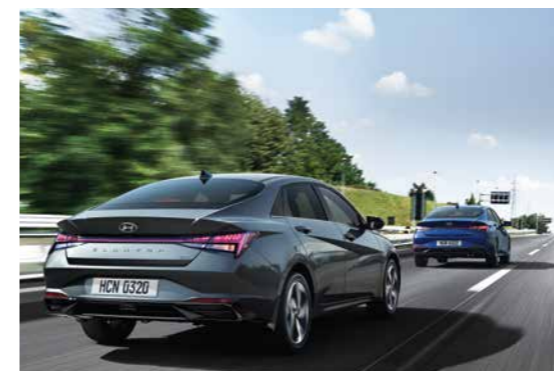
Điều khiển hành trình