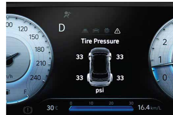
Hệ thống cảm biến áp suất lốp

Elantra hoàn toàn mới được trang bị khung gầm hoàn toàn mới để đảm bảo sự chắc chắn đi cùng hệ thống an toàn. Bên cạnh đó, động cơ Smartstream 1.6 T-GDi mới giúp Elantra trở thành chiếc xe mạnh mẽ nhất phân khúc