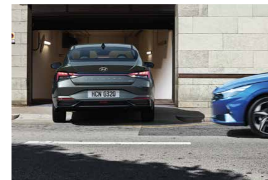
Cảm biến lùi