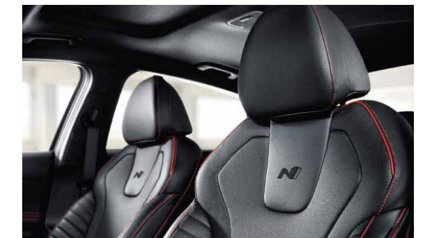
Ghế da thể thao N Line